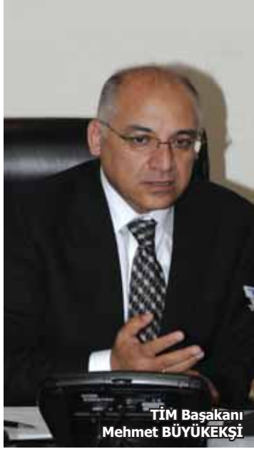
TİM Başkanı Mehmet BÜYÜKEKŞİ

• Türkiye İhracatçılar Meclisi Başkanı Mehmet Büyükekşi ve Yönetim Kurulu üyeleri, iki günlük Ankara ziyaretinde 13 bakanı ziyaret ederek hem "hayırlı olsun" dedi, hem yeni anayasa sürecine tam destek verdi, hem de ihracat odaklı kalkınma için önerilerini sundu.