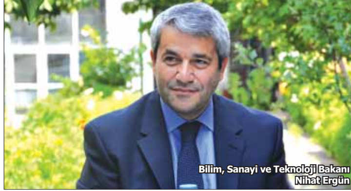
Bilim, Sanayi ve Teknoloji Bakanı Nihat Ergün

✓ Organize Sanayi Bölgeleri ile ilgili yeni Uygulama Yönetmeliği devreye girdi. Buna göre, dağınık sanayi alanları 'İslah OSB kimliği' statüsüne kavuştu