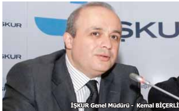
İŞKUR Genel Müdürü - Kemal BİÇERLİ

İşverenin, çalıştığı Türkiye İş Kurumu'na kayıtlı her işçinin sigortasını 30 ila 54 ay arasında devletin ödemesi, Türkiye genelinde İŞKUR'a kayıtlı işsiz sayısını 1 milyon 510 bin kişiye yükseltti.