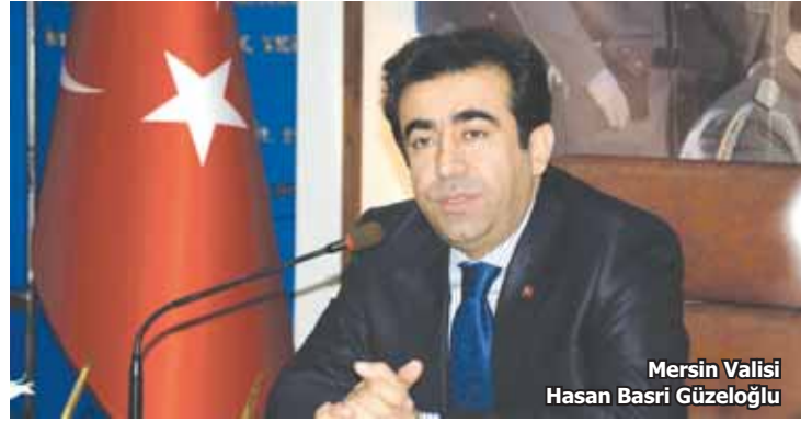
Mersin Valisi Hasan Basri Güzeloğlu

büyük önem taşıdığına vurgu yaparak, bu konudaki en büyük desteğin de mesleki eğitime yapılması gerektiğinin altını çizdi. Güzeloğlu, sözlerini şöyle sürdürdü, "Kentimizde ortaöğretim alanında mesleki eğitim oranı yüzde 36,8 civarlarında seyrediyor. Biz bu rakamı 1 yıl içerisinde gerçekleştirdiğimiz çalışmalarla yüzde 43 oranına ulaştırdık. Ancak bu rakamların da yeterli olduğu söylenemez. Mesleki eğitim alanında bir sonraki eğitim öğretim yılında hedefimizi yüzde 50 olarak belirledik. Bu konuda sanayicilerimizin konularını ve eğilimlerini de eğitime katmak istiyoruz. Mesleki eğitim konusunda kentimizde Lojistik Meslek Lisemiz yok. Mersin Üniversitesi (MEÜ) bünyesinde Lojistik Meslek Yüksek Okulu yok. Bu yapıların Mersin gibi bir lojistik kentinde olması gerekmektedir."