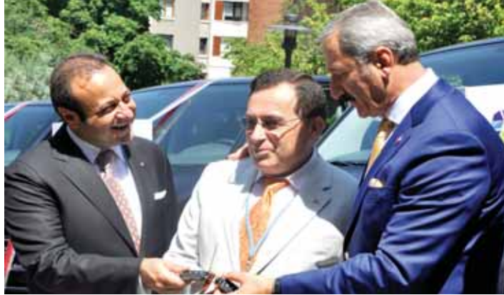
Bakan Çağlayan konuşmasının ardından, proje kapsamında beş hedef il olarak belirlenen Çorum, Samsun, Trabzon, Kahramanmaraş ve Gaziantep'in Ticaret ve Sanayi Odaları Başkanlarına, tedarik ihalesi alınan araçların anahtarlarını teslim etti.

✓ Ekonomi Bakanı Zafer Çağlayan ile AB Bakanı Egemen Bağış'ın katılımıyla gerçekleştirilen "KOBİ İşbirliği ve Kümelenme Projesi"nin açılışı, Hilton Otel'de düzenlenen törenle gerçekleştirildi.