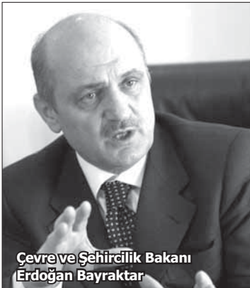
Çevre ve Şehircilik Bakanı Erdoğan Bayraktar

• Çevre ve Şehircilik Bakanı Erdoğan Bayraktar, Akdeniz, Ege ve Güneydoğu'da güneş enerjisinden yararlanmayı amaçlayan kentsel dönüşüm projelerine yoğunlaşacaklarını açıkladı.