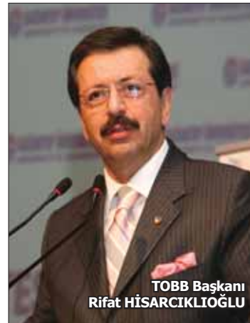
TOBB Başkanı Rifat HİSARCILIOĞLU

EPDK Başkanı Hasan Köktaş ise bugün 72 rüzgar santrali sayısına ulaşıldığını söyleyerek, "Devreye alınan tesislerin yatırım tutarı 1.6 milyar dolar euro'yu buldu" dedi. 48 bin MW kurulu gücündeki 802 adet rüzgar enerji santrali başvurusunda son aşamaya geldiğini bildiren Köktaş, "TEİAŞ tarafından 10 paket halinde yarışmalar tamamlandı, hızlı şekilde lisanslandırılıyor. 9 milyar euroluk bir tutara denk geliyor. Özel sektör üzerine düşen sorumluluğu yerine getirerek, bir an önce bu santralleri tamamlamalı" diye konuştu.