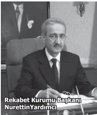
Rekabet Kurumu Başkanı Nurettin Yardımcı