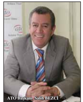
ATO Başkanı Salih BEZCİ

büyümeyi sürdürmenin yolu da ihracat gelirlerini artırmaktan geçiyor. Türk işletmeleri ve ihracatçılarımız dış piyasalardaki açılımını, son dönemdeki dış politika açılımı hızına paralel olarak artırabilirlerse cari açık sorununun çözümüne de ciddi bir katkı sağlayabiliriz."