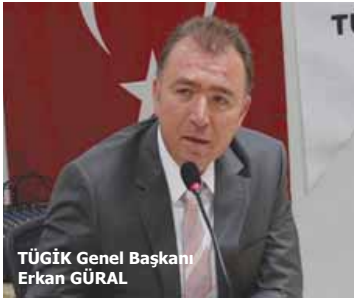
TÜGİK Genel Başkanı Erkan GÜRAL

Türkiye Genç İşadamları Konfederasyonu (TÜGİK) Genel Başkanı Erkan Güral, yeni Ticaret Kanunu'nun Türk işletmelerini bütün unsurlarıyla birlikte kurumsallaşmaya yöneltecek olması nedeniyle son derece önemli olduğunu belirterek, Türk Ticaret Kanunu'yla birlikte Türkiye'nin uluslararası ticaretin kurallarına uyan ve onun dilini konuşan bir ülke haline geleceğinin altını çizdi. TÜGİK Genel Başkanı Erkan Güral Türk Ticaret Kanunu Tasarısı'nın TBMM'de genel bir uzlaşıyla kabul edilerek yasalaşmasının Türk iş dünyası için bir dönüm noktası olduğunu vurguladı.